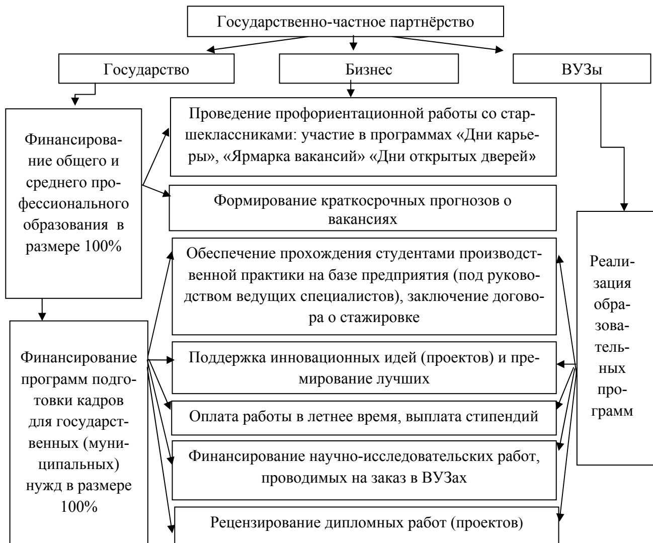
Рис. 1. Организационная схема реализации проекта текущей подготовки кадров на основе государственно-частного партнёрства

кадров и переподготовку имеющихся незанятых специалистов на рынке труда в работе приведена усовершенствованная форма подобного сотрудничества. Взаимодействие при этом будет отличаться от стандартной модели бипартизма, так как участвуют три стороны: государство, бизнес и ВУЗы (формируется модель трипартизма) (рис. 1).